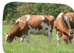
FRIES ROODBONT VEE