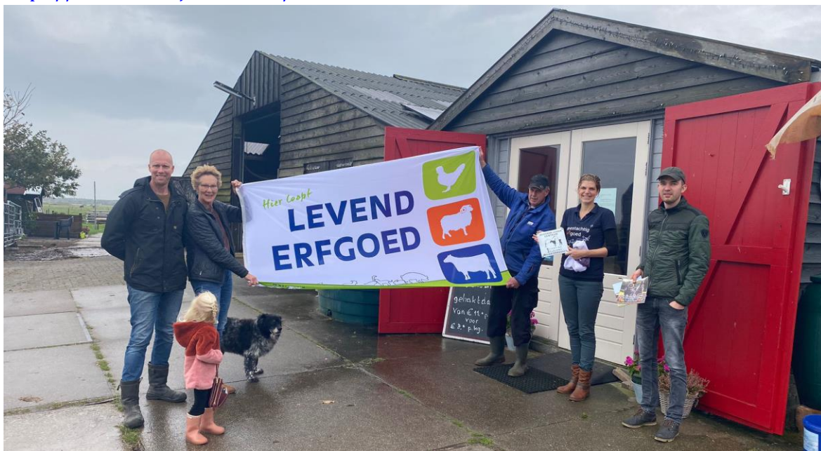
Foto: uitreiking op Bioboerderij Ameland